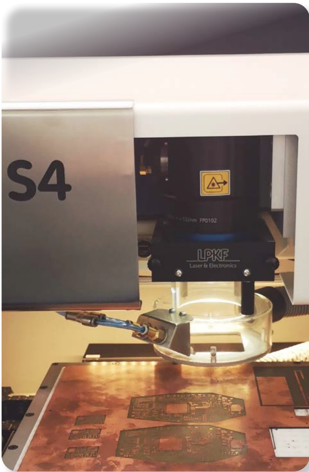
Protolaser S4 LPKF co-financé par la Région des Pays de Loire et le FEDER dans le cadre du RFI Wise